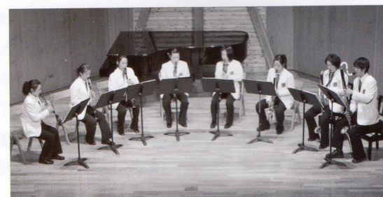
2011年 クラリネット8重奏、東海大会金賞