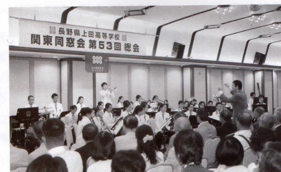
2014年6月 関東同窓会で初めて演奏