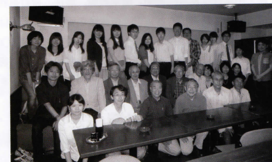
2014年8月 第6回OB会設立準備委員会