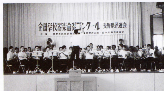
1963年 NHK 器楽コンクール初出場